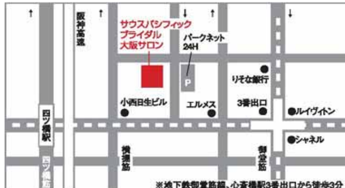
大阪店 〒542-0081 大阪市中央区南船場4-12-24 現代心斎橋ビル11F